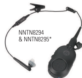
NNTN8294 & NNTN8295*

L'audio Bluetooth 2.1 è integrato nella radio per consentire l'accoppiamento rapido e sicuro con una varietà di accessori Bluetooth. Semplici da collegare e abbinare, gli accessori Bluetooth Motorola migliorano le prestazioni e la sicurezza in qualunque ambiente di lavoro. Gli agenti possono comunicare in maniera discreta quando sono in incognito, spostarsi senza l'ingombro di cavi e usare la loro radio come mai prima.