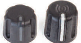
Manopola di controllo standard

◀ Anelli identificativi colorati opzionali per gruppi impegnati in mansioni, aree di copertura o turni differenti