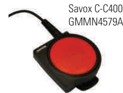
Savox C-C400 GMMN4579A

La soluzione si può completare con l' unità di controllo Savox C-C400 che consente l'uso della radio bidirezionale in condizioni di pericolo. Studiata per essere particolarmente robusta per l'uso negli ambienti più estremi, il grande pulsante PTT garantisce la trasmissione anche se utilizzato sotto gli equipaggiamenti e gli indumenti protettivi.