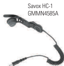
Savox HC-1 GMMN4585A

Il Savox HC-1 è un'unità compatta combinabile con casco per i professionisti che lavorano in condizioni rischiose. Si monta facilmente sulla maggior parte degli elmetti e offre comunicazioni chiare e a mani libere che lo rendono un accessorio particolarmente adatti a vigili del fuoco e squadre di salvataggio.